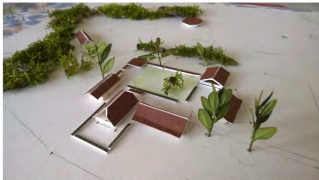
Het gaat hier om een concept voor (samen)wonen rond een erf in kleinschalige energie leverende woningen en gezamenlijk gebruik van de bestaande boerderij.

Dat is onze ambitie. Samenwerken en aandacht voor elkaar zijn de sociale uitgangspunten. Passief en low tech is de bouwkundige insteek. Bovendien kunnen we door het delen van spullen en verantwoord water- en energiegebruik een mooie bijdrage leveren. Bij duurzaam gaat het om een betere wereld voor onszelf en de generaties na ons. Op de Veldhuis pagina is te zien hoe de pilot zich ontwikkelt.